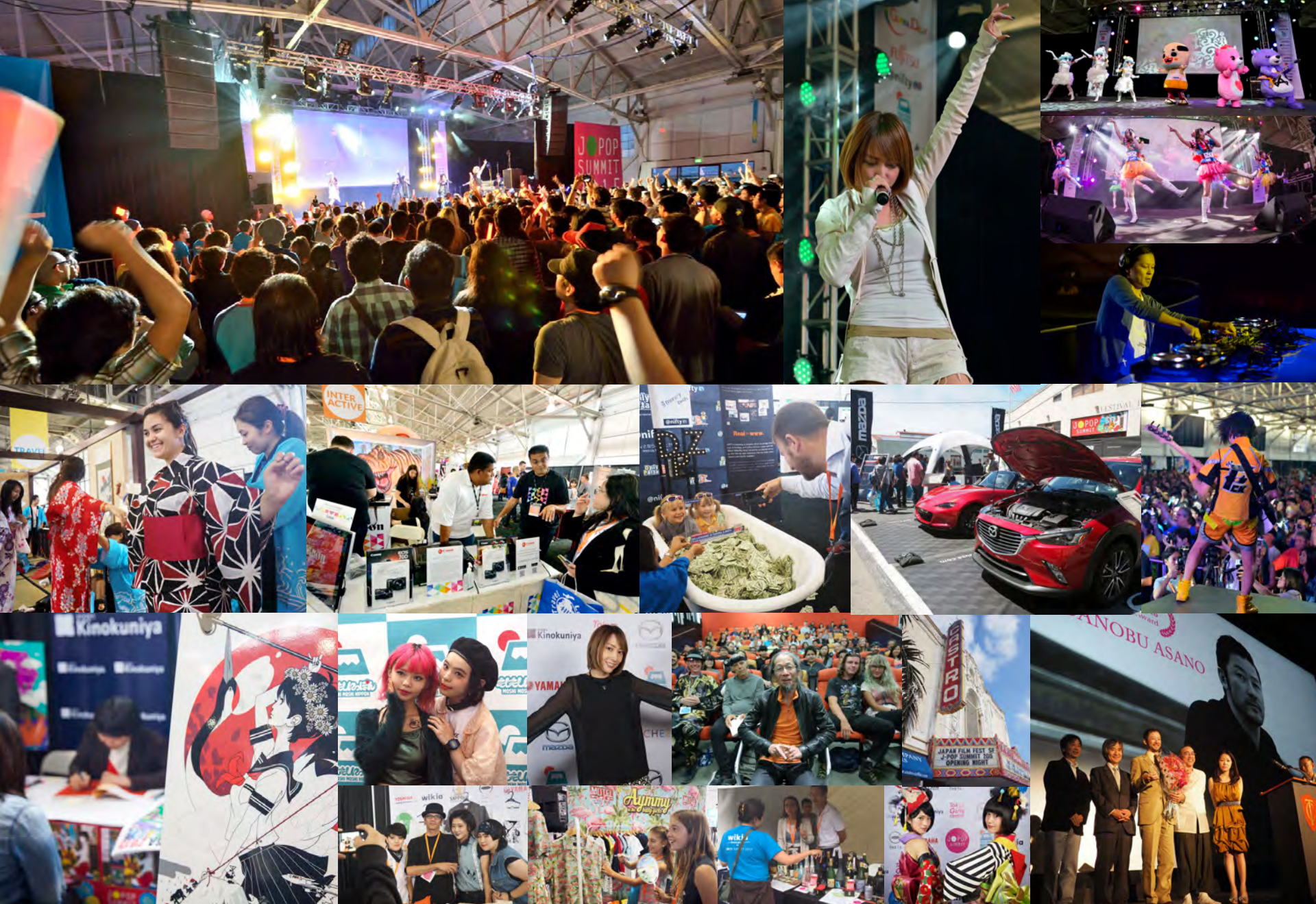
MUSIC LIVE PERFORMANCES | INTERACTIVE PAVILION | TRAVEL AREA | MEET & GREET | FASHION AREA | FILM SCREENINGS AND Q&A | OPENING RECEPTION | SAKE SUMMIT & MORE